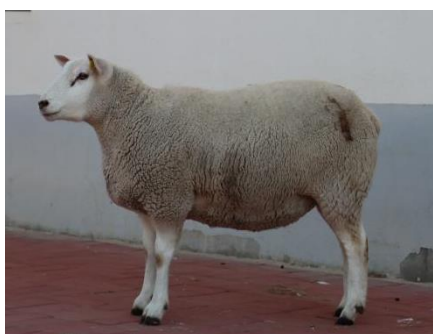
图 A.4 母羊侧面照