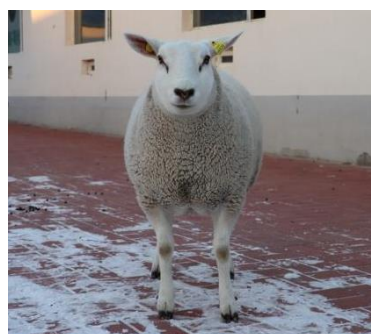
图 A.5 母羊正面照