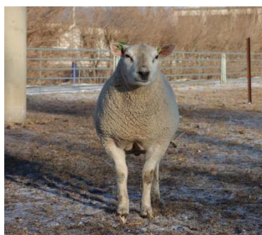
图 A.2 公羊正面照