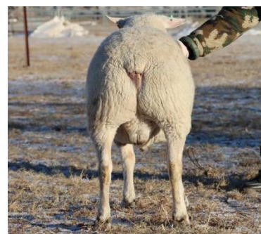
图 A.3 公羊后躯照