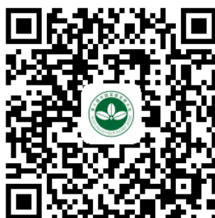
第八届中国苜蓿发展大会报名二维码

登录中国畜牧业协会网站（或草网）点击“第八届中国苜蓿发展大会在线报名”；关注中国畜牧业协会草业分会微信公众账号，点击左下角大会报名；或扫描下方二维码，进行报名（三选一即可）。